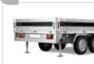
Piedi di stazionamento