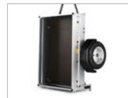
Può essere riposto in posizione verticale.