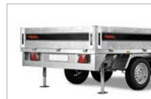
Piedi di stazionamento