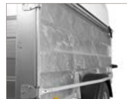
Sponde alte 80 cm.

A pag. 26-29 troverete ulteriori dettagli oppure visitate il sito ellebi.com