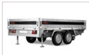
Piedi di stazionamento