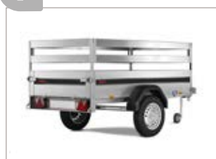
Sovrasponde a scala in alluminio