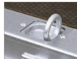
Occhielli di fissaggio del carico integrati di serie.

AB/ATB indicano rimorchi con sponde in alluminio mentre S/SB/STB indicano rimorchi con sponde in acciaio. A pag. 26-29 troverete ulteriori dettagli oppure visitate il sito ellebi.com