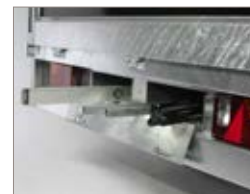
Box portaoggetti integrato.

AB/ATB indicano rimorchi con sponde in alluminio mentre S/SB/STB indicano rimorchi con sponde in acciaio. A pag. 26-29 troverete ulteriori dettagli oppure visitate il sito ellebi.com