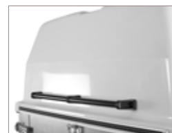
Coperchio con maniglia integrata.