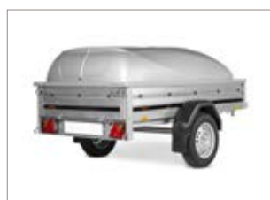
Coperchio in ABS