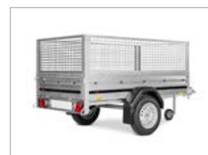
Sovrasponde a rete