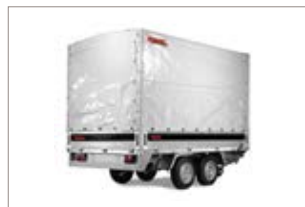
Kit centina e telo