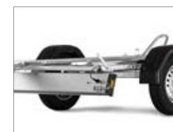
Il pannello delle luci si inclina per facilitare il carico/scarico.