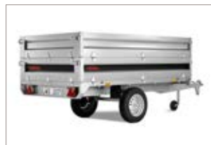
Sovrasponde in acciaio