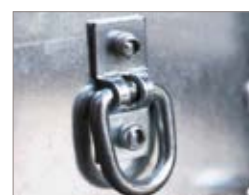
Ganci di fissaggio carico interni.

I modelli 3251 hanno tutte e quattro le sponde apribili A pag. 26-29 troverete ulteriori dettagli oppure visitate il sito ellebi.com