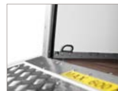
Occhielli di fissaggio carico integrati.