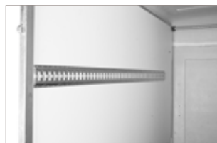
Barra di ancoraggio