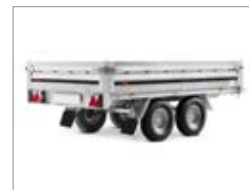
Ampio pianale di carico.

Questa serie è caratterizzata da una struttura robusta e la maggior parte dei modelli è fornita con la comodità delle quattro sponde apribili. Inoltre, le ruote sotto al pianale, permettono un grande spazio di carico, che può essere facilmente personalizzato grazie alla vasta gamma di accessori.