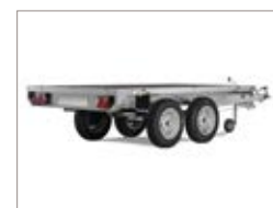
Tutte le sponde possono essere aperte e rimosse.