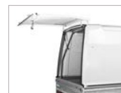
Accesso possibile anche dalla parte posteriore.