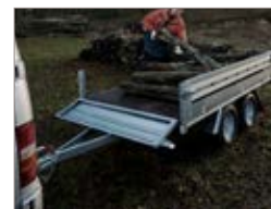
Sponda anteriore apribile di serie.