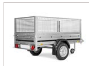
Sovrasponde a rete