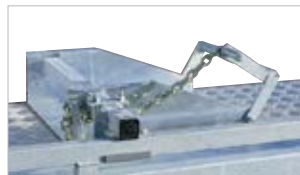
Fermo ruota con catena