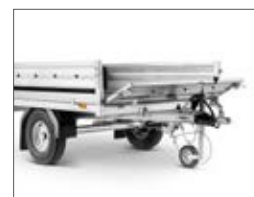
Sponda anteriore apribile di serie.