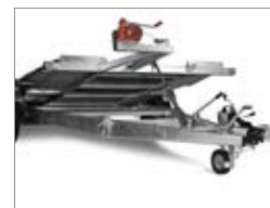
Argano e cavo forniti di serie.