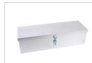
Cassetta porta attrezzi