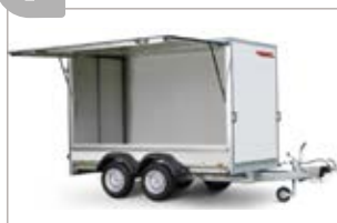
Pannello laterale per eventuale funzione vendite