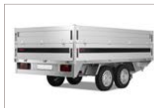
Sovrasponde in acciaio