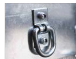
Ganci di fissaggio carico interni.