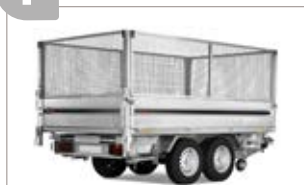
Sovrasponde a rete