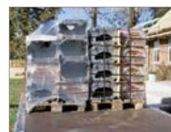
Adibito al trasporto di due Euro pallets per lato.