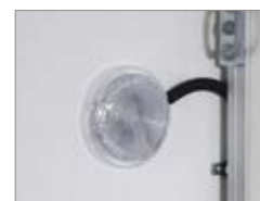
Luci interne (tranne per quelli con altezza 130 cm).