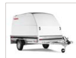
Dotato di pratiche maniglie anteriori.