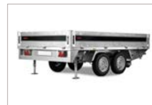
Sovrasponde a rete