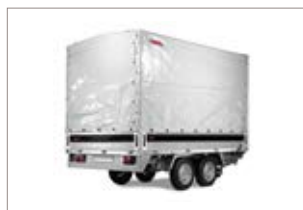
Kit centina e telo