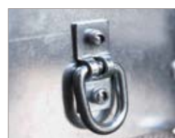
Ganci di fissaggio carico interni.