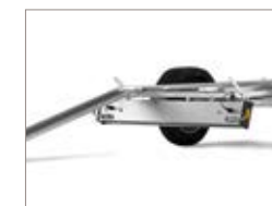
La rampa può essere posizionata comodamente da un lato all'altro.