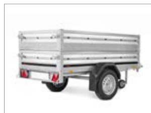
Sovrasponde in acciaio