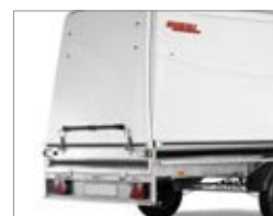
Dotato di serratura di serie.

A pag. 26-29 troverete ulteriori dettagli oppure visitate il sito ellebi.com