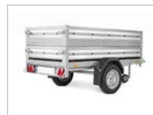
Sovrasponde in acciaio