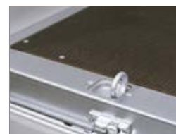
Occhielli di fissaggio carico integrati nel profilo robusto in acciaio.