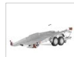
Inclinazione delle rampe di soli 12°.