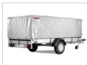
Kit centina e telo