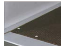
Profili in acciaio proteggono il pianale.