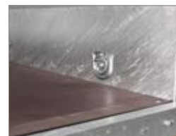
Occhielli di fissaggio carico interni al cassone.