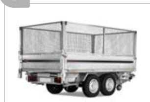
Sovrasponde a rete