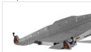
Base in alluminio