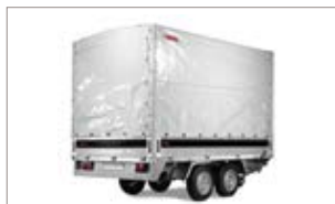
Kit centina e telo