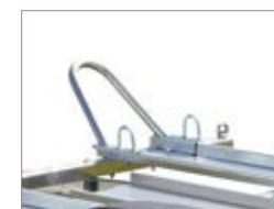
Fissaggio sicuro delle moto.