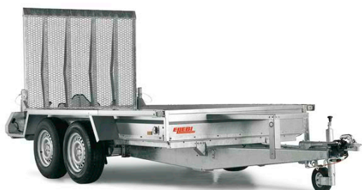
MT 3080 - COD. 302134