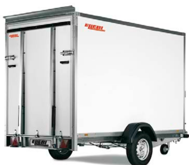
LBF 7260 SBR 153x185 - COD. 308267