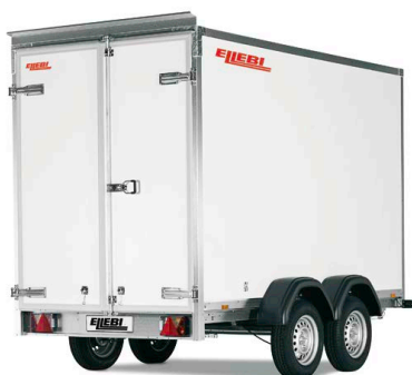
LBF 7350 TBA 153x185 - COD. 308270