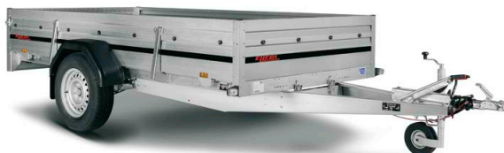
LBC 2300 SB - COD. 308673