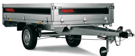
LBC 4260 SBA - COD. 121726