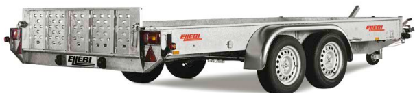
UT53 - COD. 303044