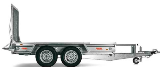
MT 3651 - COD. 303043