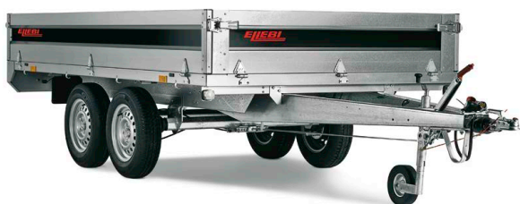
LBC 4310 TBA - COD. 121724