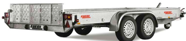
UT59 - COD. 303045