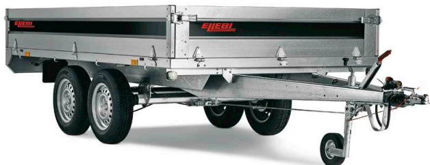
LBC 4310 TB - COD. 121736