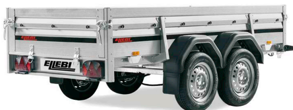
LBC 2300 TB - COD. 308713