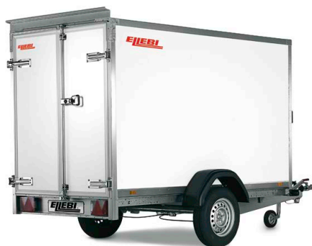
LBF 7260 SBA 153x185 - COD. 308266