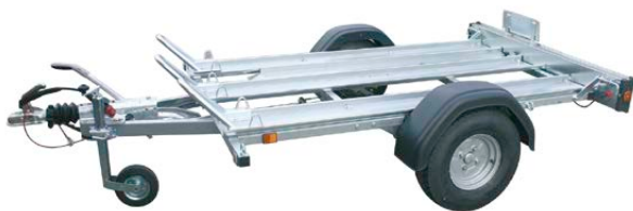
Foto relativa a rimorchio con freni