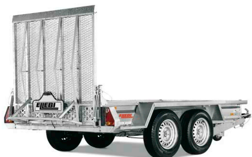
MT 2600 - COD. 305924