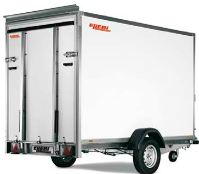
LBF 7260 SBR 130x185 - COD. 308265