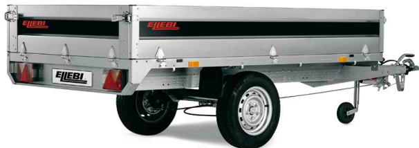
LBC 4260 SB - COD. 121732