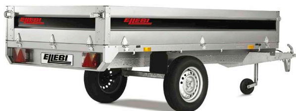
LBC 4260 S - COD. 121730