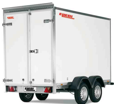
LBF 7300 TBA 153x185 - COD. 308268