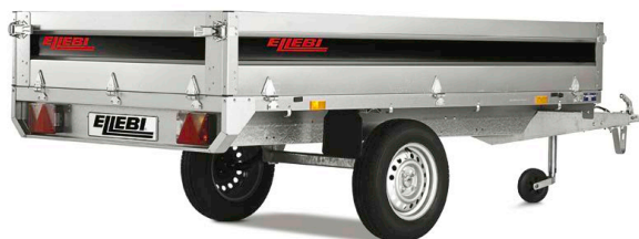
LBC 4260 SBAH - COD. 121720